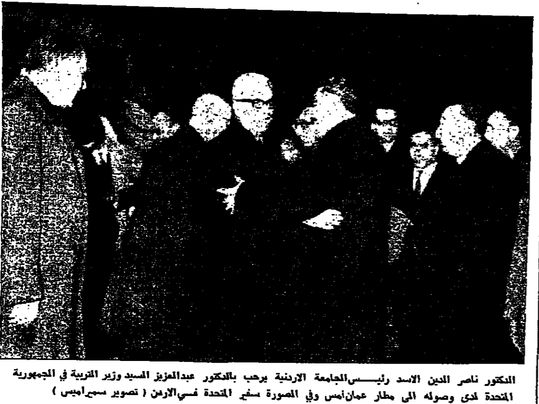
المشكور ناصر الدين الاسد رئيس الجامعة الاردنية يرحب بالمشكور عبدالعزیز السيد وزير التربية في الجمهورية المتحدة لدى وصوله الى مطار عمان امس وفي الصورة سفر المتحدة في الامم